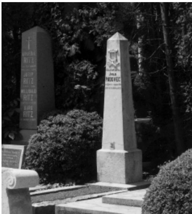
Padovčevo posljednje počivalište na varaždinskom groblju.

dovčevoj smrti tek je kratko izviješteno u varaždinskom tisku, uz napomenu da je do kraja života radio na skladbama za treći svezak zbirke Vilini glasi 76. Opširniji nekrolog objavio je F. Plohl-Herdvigo u časopisu Vienac 24.