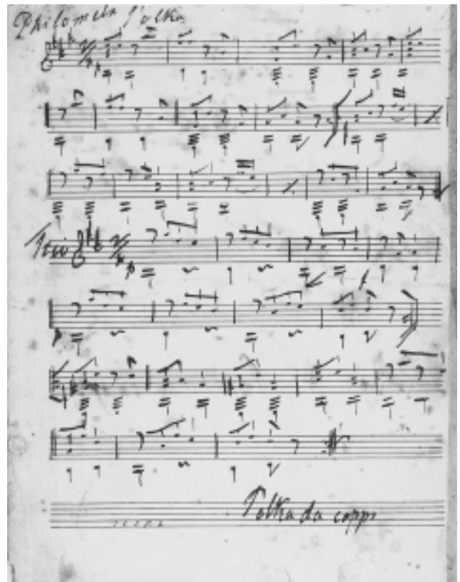
Padovčev prepoznatljiv rukopis. Ovaj autograf potječe iz Kuhačeve zbirke koja je pohranjena u Nacionalnoj i sveučilišnoj knjižnici u Zagrebu.

U to vrijeme Zagreb je očito postao pretijesan za mladog temperamentnog gitarista koji je po svemu sudeći sjajno ovladao tehnikom svog instrumenta i koji je – u skladu s proširenom praksom u ono vrijeme – publici mogao ponuditi i vlastite skladbe. Već je 1827. godine Padovec iz Zagreba bio pošao na turneju tijekom koje je obišao Rijeku, Zadar i Trst. Do sada nisu pronađene kritike njegovih nastupa u tim gradovima. Međutim, prvi Padovčev biograf tvrdi da je svugdje bio dobro primljen i da ga je to ponukalo da se otputi u Beč 21.